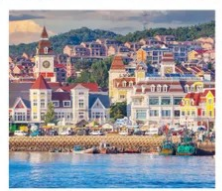
ท่าเรือประมงเหยียนโกะ