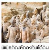
พิพิธภัณฑสถานกองทัพใต้ดิน