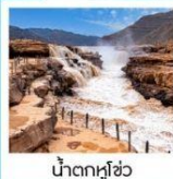
น้ำตกหูซิว