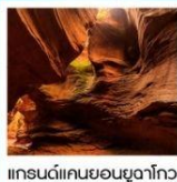
แกรนด์แคนยอนยูงาโกว