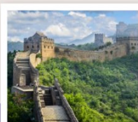
ท่าแพงเมืองจิน