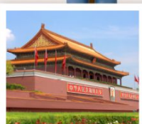
เทียนอันเหมิน

ท่าแพงเมืองจินด่านจวิหยงกวน / สนามกีฬาอังก / ซุปปิ้งย่านซานหลี่ถุน / วัดลามะ จัตุรัสเทียนอันเหมิน / พระราชวังโบราณกุ๊กก / หอประชุมเทียนถาน / พระราชวังฤดูร้อนอวิ๋เหอหยวน