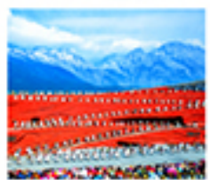
ไร่จางอวี่ใหม่