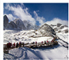
ภูเขาหินมังกรหยก

ลัดขีตมอว๋อ / ไร่ตมอว๋อ / เมืองโบราณเซกซีล่า / วัดลามซงจันหลิง / ช่องแคบเส็งกรรไกร เมืองโบราณรุ่งทอ / ภูเขาหินมังกรหยก / ภูเขาพระฉินกรี่สีน้ำเงิน / ไร่จางอวี่ใหม่ สะพานมังกรดำ / สพานแก้วลี่เจียง / เมืองโบราณลี่เจียง ต้าหลี่ทง / วัดหยวนทง