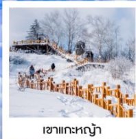
เขากระหลว้า