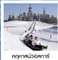
คฤหาสน์วอลการ์