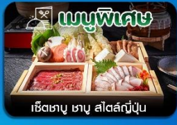
เช็ตเชนุ ซามู สไตล์ญี่ปุ่น