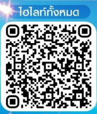
ไอโลกั๊งกมด