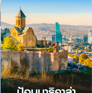
ป้อมนาริกาล่า