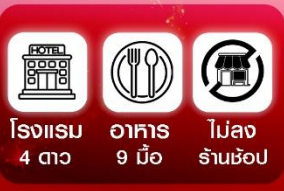
โรงแรม 4 ดาว