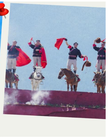
การแสดงความประทับใจแห่งลี่เจียง (Impression of Lijiang)

นำท่านชม ธารน้ำขาวไปสู่เหอ หรือ ทะเลสาบไปสู่เหอ (รวมค่าบริการรถแบตเตอรี่) ทะเลสาบสีเทอร์ควอยซ์ตัดกับวิวต้นไม้ ท่ามกลางขุนเขาแห่งหุบเขาพระจันทร์สีน้ำเงิน ฉากของภูเขาหิมะมังกรหยก มีน้ำตกหินปูนชั้นบันไดขนาดเล็กลดหลั่นลงมาอย่างสวยงาม น้ำที่ไหลผ่านหุบเขานี้คือน้ำที่ละลายจากหิมะบนยอดเขาหิมะมังกรหยก เนื่องจากจุดนี้มีทิวทัศน์ที่สวยงามมีฉากหลังคือภูเขาหิมะมังกรหยกมีน้ำตกและแม่น้ำกึ่งทะเลสาบจึงเป็นที่นิยมของนักท่องเที่ยวช่างภาพและคู่รักเป็นอย่างมาก อิสระเก็บภาพประทับใจตามอัธยาศัย