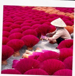
หมู่บ้านรูป