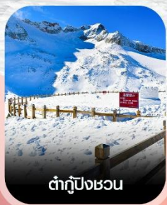
ตำกู่ปิงชวอน

✈️ คอนเฟิร์มออกเดินทาง ทุกพีเรียด 2 ท่านขึ้นไป ✈️