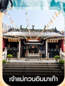
เจ้าแม่กวนอิมมาเก๊า

✈ คอนเฟิร์มออกเดินทาง ✈ ทุกพีเรียด 2 ท่านขึ้นไป