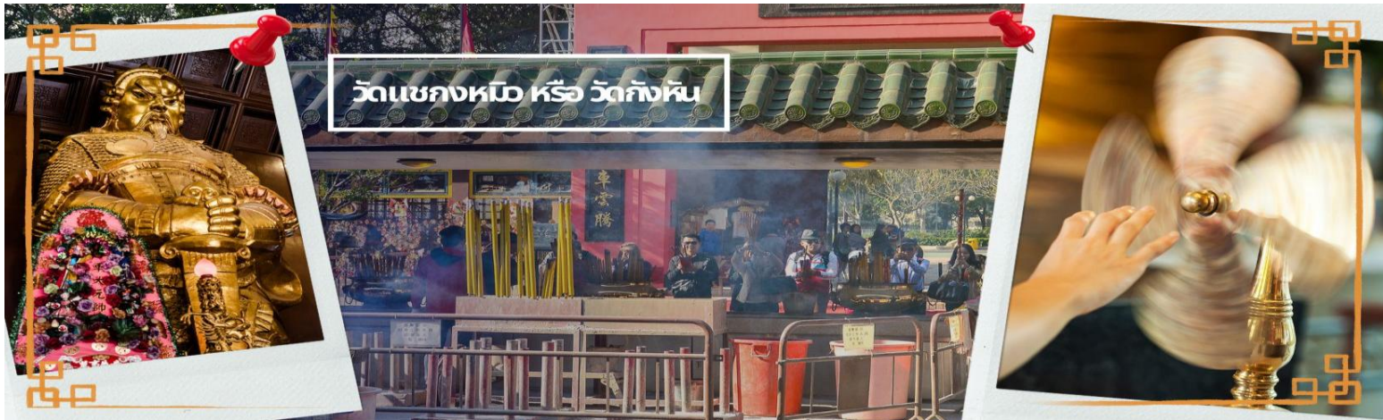
วัดเข่งหม้อ หรือ วัดกั๊กหัน

จากนั้นเดินทางสู่แหล่งช้อปปิ้ง ย่านจิมซาจуй (TSIM SHA TSUI) สัมผัสบรรยากาศร้านเสื้อผ้า ร้านอาหาร และร้านขายเครื่องประดับที่แข่งกันเรียกลูกค้าตลอดแนวถนนที่มีทั้งสินค้าหรูหราและอุปกรณ์อิเล็กทรอนิกส์ ตั้งอยู่บนถนนนาธาน ถนนทอดยาวตั้งแต่ จิมซาจуй จนถึงย่าน ปรีนซ์เอ็ดเวิร์ด เต็มไปด้วยร้านค้าต่างๆมากมายทั้งเสื้อผ้าแบรนด์เนมระดับ HI-END ชื่อดังทั่วโลก ห้างสรรพสินค้าที่ทันสมัย จากถนนนาธานไปที่ถนนแคนตัน ท่านจะตื่นตาตื่นใจไปกับเอาท์เล็ตแบรนด์ที่เรียงติดกันเป็นแถบ นอกจากนี้ยังมี HARBOUR CITY ศูนย์การค้ายักษ์ใหญ่ของฮ่องกง ซึ่งมีร้านค้ากว่า 450 ร้านรวมอยู่ที่นี้ และมี SHOPPING COMPLEX ขนาดใหญ่ชื่อ OCEAN TERMINAL ซึ่งประกอบไปด้วยห้างสรรพสินค้าเรียงรายกันอยู่และมีทางเชื่อมติดต่อกันสามารถเดินทะลุถึงกันได้ให้แบรนด์ดังมากมายให้ท่านได้เลือกซื้อ หรือจะชมวิวของอ่าววิกตอเรีย เดินเล่นบริเวณใกล้ๆ จิมซาจуйเริ่มต้นจากหอนาฬิกาสมัยอาณานิคม แถวนี้มีทัศนียภาพที่สวยงามที่สุดแห่งหนึ่งสำหรับการชมวิวตามแนวท่าเรือของเกาะฮ่องกง เป็นตัวเลือกให้ท่านไปเยี่ยมชมอีกด้วย สมควรแก่เวลานำคณะออกเดินทางสู่สนามบินฮ่องกง