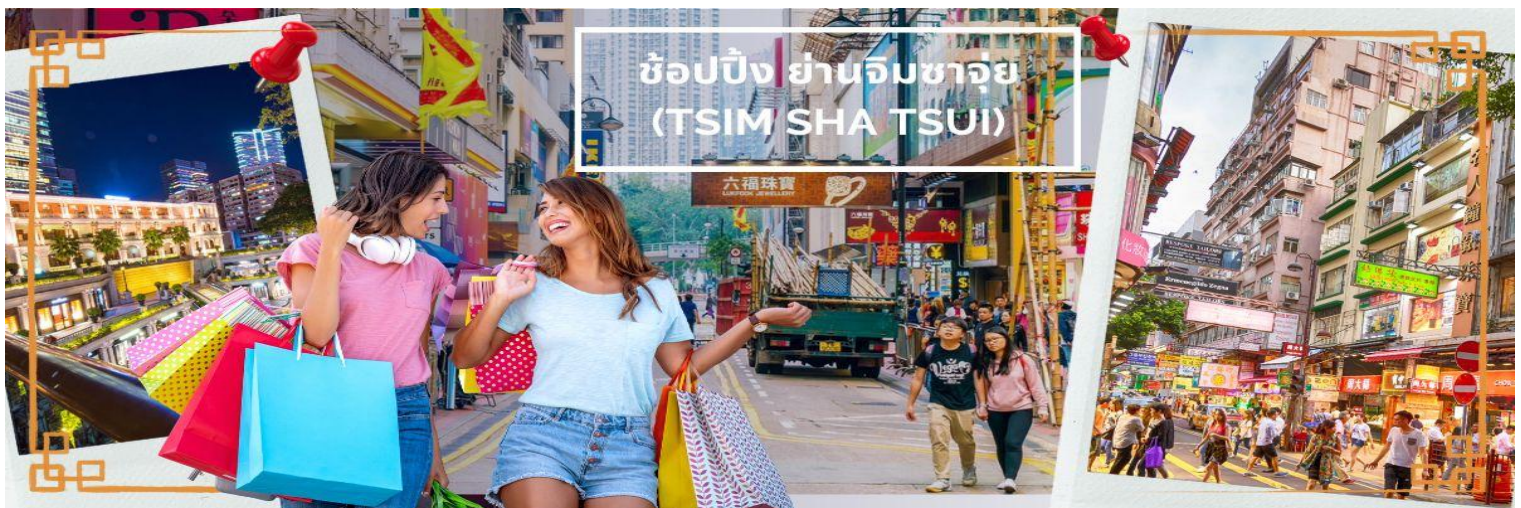
ช้อปปิ้งย่านจิมซาจуй (TSIM SHA TSUI)

จากนั้นเดินทางสู่แหล่งช้อปปิ้ง ย่านจิมซาจуй (TSIM SHA TSUI) สัมผัสบรรยากาศร้านเสื้อผ้า ร้านอาหาร และร้านขายเครื่องประดับที่แข่งกันเรียกลูกค้าตลอดแนวถนนที่มีทั้งสินค้าหรูหราและอุปกรณ์อิเล็กทรอนิกส์ ตั้งอยู่บนถนนนาธาน ถนนทอดยาวตั้งแต่ จิมซาจуй จนถึงย่าน ปรีนซ์เอ็ดเวิร์ด เต็มไปด้วยร้านค้าต่างๆมากมายทั้งเสื้อผ้าแบรนด์เนมระดับ HI-END ชื่อดังทั่วโลก ห้างสรรพสินค้าที่ทันสมัย จากถนนนาธานไปที่ถนนแคนตัน ท่านจะตื่นตาตื่นใจไปกับเอาท์เล็ตแบรนด์ที่เรียงติดกันเป็นแถบ นอกจากนี้ยังมี HARBOUR CITY ศูนย์การค้ายักษ์ใหญ่ของฮ่องกง ซึ่งมีร้านค้ากว่า 450 ร้านรวมอยู่ที่นี้ และมี SHOPPING COMPLEX ขนาดใหญ่ชื่อ OCEAN TERMINAL ซึ่งประกอบไปด้วยห้างสรรพสินค้าเรียงรายกันอยู่และมีทางเชื่อมติดต่อกันสามารถเดินทะลุถึงกันได้ให้แบรนด์ดังมากมายให้ท่านได้เลือกซื้อ หรือจะชมวิวของอ่าววิกตอเรีย เดินเล่นบริเวณใกล้ๆ จิมซาจуйเริ่มต้นจากหอนาฬิกาสมัยอาณานิคม แถวนี้มีทัศนียภาพที่สวยงามที่สุดแห่งหนึ่งสำหรับการชมวิวตามแนวท่าเรือของเกาะฮ่องกง เป็นตัวเลือกให้ท่านไปเยี่ยมชมอีกด้วย สมควรแก่เวลานำคณะออกเดินทางสู่สนามบินฮ่องกง