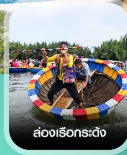
ล่องเรือกระดิ่ง

คอนเฟิร์มออกเดินทาง ทุกพีเรียด 2 ท่านขึ้นไป