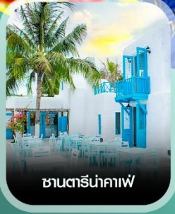
ซานตาเร็นคาเฟ