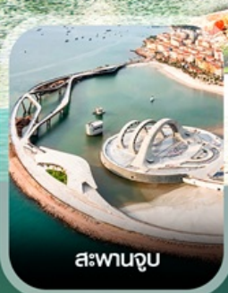
สะพานจูป