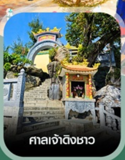
ศาลเจ้าดิ้งซาอว