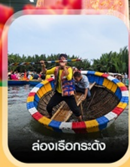
ล่องเรือกระดิ่ง

✈️ คอนเฟิร์มออกเดินทาง ทุกพีเรียด 2 ท่านขึ้นไป