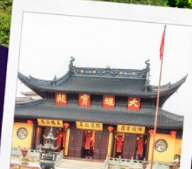
วัดพระหยก