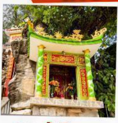
ศาลเจ้าติงซาอว