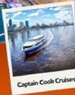
Captain Cook Cruises