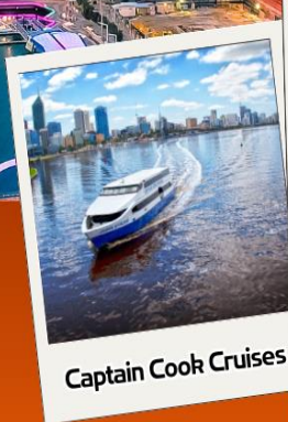
Captain Cook Cruises