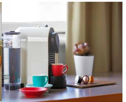
(โรงแรมย่านกลางเมือง ใกล้แหล่งช้อปปิ้ง เดินทางสะดวก) *รูปภาพเพื่อการโฆษณา*

นำท่านเดินทางเข้าสู่ที่พัก NOVOTEL LANGLEY PERTH HOTEL หรือเทียบเท่า (4 ดาว****)