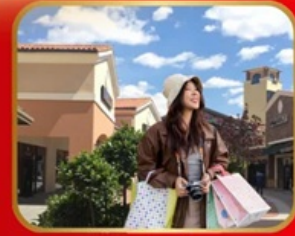
อิสระช้อปปิ้ง BEIJING OUTLET