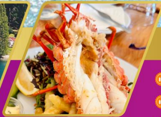
ทุ่งมิงกรท่ามกลางครั้งตัว