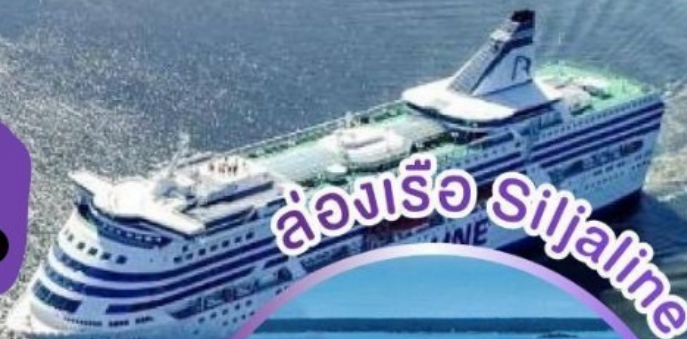
ล่องเรือ Siljeline