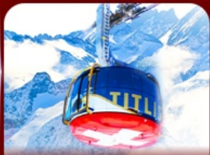
*Optional* นั่งกระเช้าชมวิวทิวทัศน์