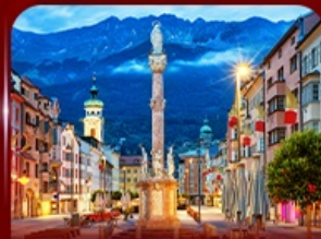
เที่ยวย่านเมืองเก่า อินส์บรุค