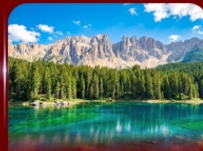
ชมวิวดอโลไมท์ ทะเลสาบคาเรซา