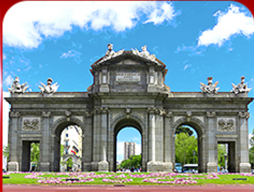
เช็ควินประตูอัลกาลา มาดริด