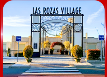
Las Rozas Village เอากีเลียน