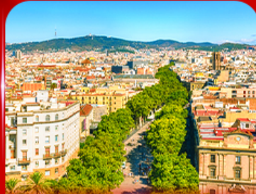
ลาริมบลาสตริก บาร์เซโลนา