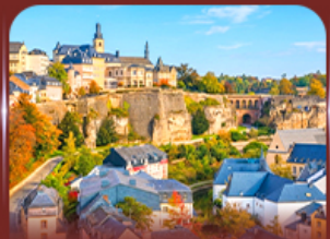
ย่านเมืองเก่า ลักเซมเบิร์ก