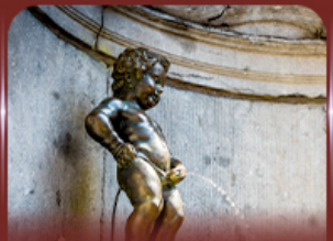
manneken pis บรัสเซลส์