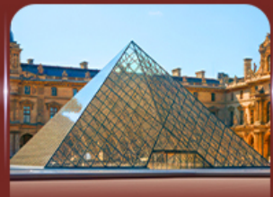
เซ็งอินพีพริกทินท์ลูฟวร์ ปารีส