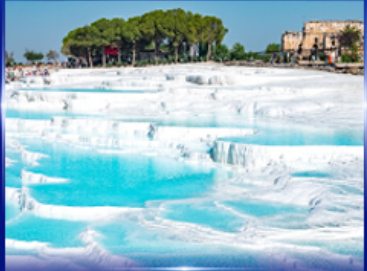
ปราสาทบุนย้าช ปามุกคาลา