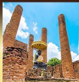
วัดธรรมิกราช