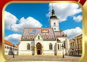
โบสถ์เซนต์มาร์ก ชากรบ