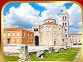
โบสถ์เซนต์มาร์ก ชากรบ