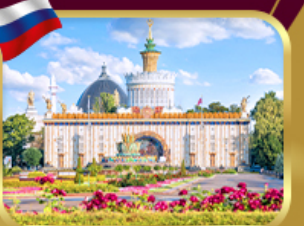
สวนสาธารณะ VDNKH