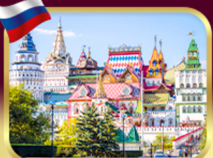
อิสมายลอฟสกีมาร์เก็ต