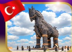
ม้าไม้เมืองกรอย ซานักคาล์