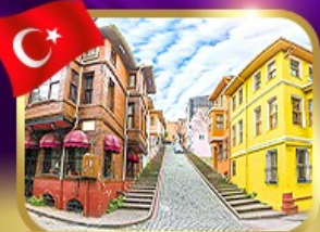
ชมบ้านหลากสีย่านบาลิก