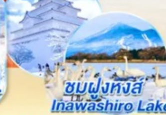
ชมฝูงหงส์ Inawashiro Lake