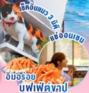
ช็อคอินแมว 3 มิติ แช่ออนเซน อิมมูร่อย บุฟเฟ่ต์งปู

ราคาเริ่มต้น 35,888 รวมภาษีมูลค่าเพิ่ม 7%