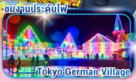
ชมงานประดับไฟ