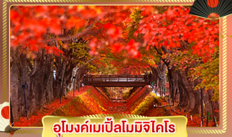
อุโมงค์เมเปิ้ลโมมิจิโคโร