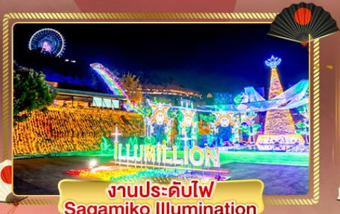
งานประดับไฟ Sagamiko Illumination