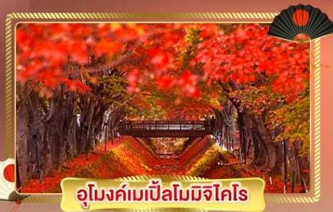
อุโมงค์เมเปิ้ลโมมิจิโคโร