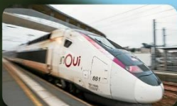
น้ังรถไฟความเร็วสูง TGV