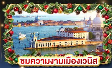
ชมความงามเมืองเวนิส