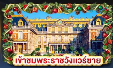
เข้าชมพระราชวังแวร์ซาย