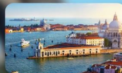
ชมความงามเมืองเวเน้ิส