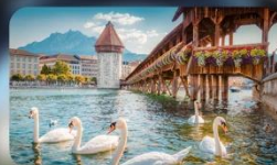
สะพานม้้ชาเปล