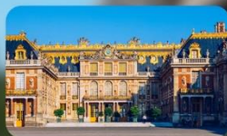
ท้้าชมพระราชวง้จ้แวง้ชยาล้