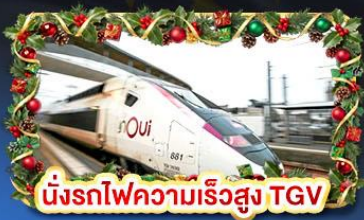
นั้รรถไฟความเร็วสูง TGV