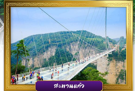
สะพานแก้ว