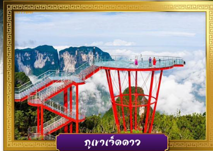
ภูเขาเว็ดดาว

✓ เดินเล่นถนนคนเดินหวงชิ่งลู่และซีปู้เจีย