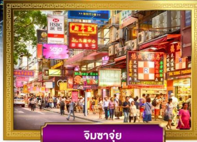
จิมซาจุ่ย