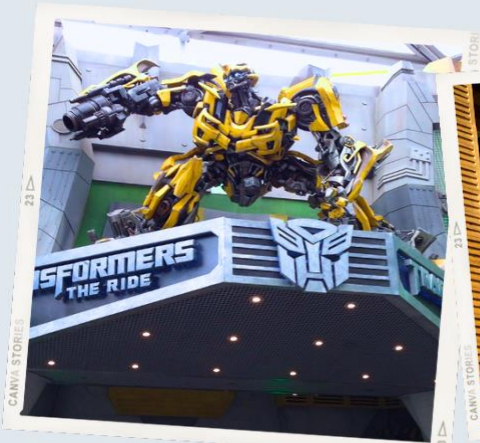
ZONE 1 : HOLLYWOOD