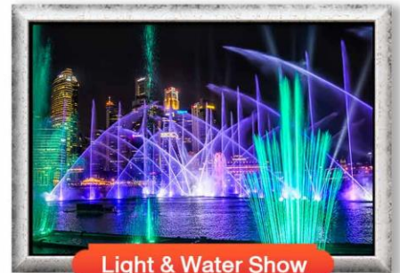
Light & Water Show