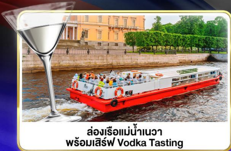
ล่องเรือแม่น้ำวอวา พร้อมเสิร์ฟ Vodka Tasting