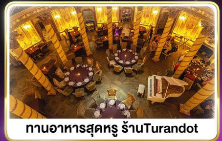
ทานอาหารสุดหรู ภัตตาคารTurandot