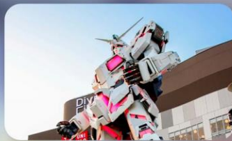
ช้อปปิ้งโอไดบะ