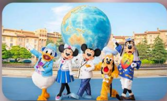
อิสระตามอัธยาศัย 2 วัน