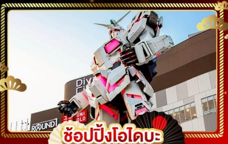
ช้อปปิงโอไดบะ