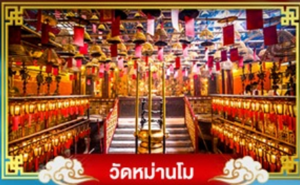
วัดหม่านโม

พักกลางวัน "จิมซาร์จ" บินหรูฉลองเทศกาลปีใหม่ ณ เกาะฮ่องกง