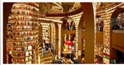
ร้านหมิงซือจงซูเก้อ