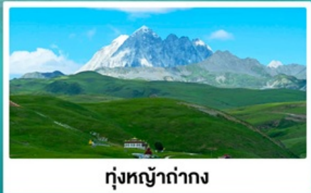
ทุ่งหญ้าท่ามกลาง