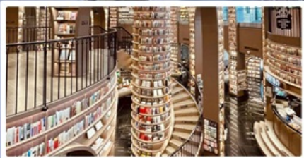
ร้านหนังสือจุงชู่เก๋อ