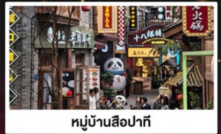
หมู่บ้านสี่牌坊