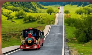
ทิวเจานางฟ้า