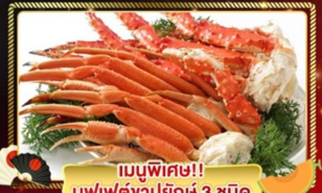
เมนูพิเศษ!! บุฟเฟ่ต์ขาปูยักษ์ 3 ชนิด