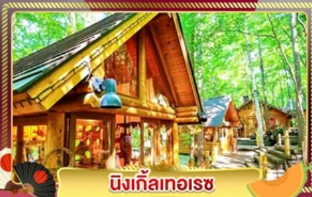
นิงเกิ้ลทอเรซ

ชมทุ่งลาเวนเดอร์ และทุ่งดอกไม้ขึ้นชื่อของฮอกไกโด ฟาร์มโทมิตะ และ ชิโกะไซโนะโอะกะ