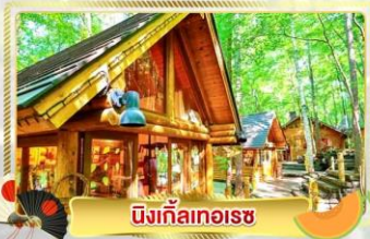
นิงเกิ้ลทอเรซ