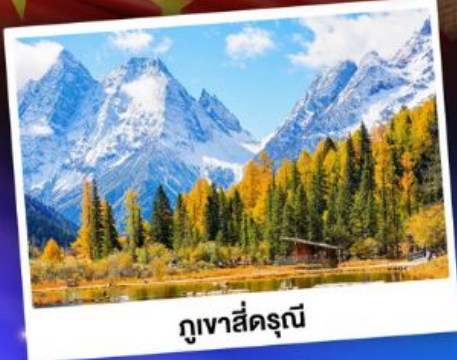
กุเวาสีครุณี

ชมบรรยากาศใบไม้เปลี่ยนสี "สถานที่ท่องเที่ยว 5A อุทยานจิวจ้ายโกว"