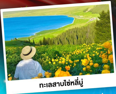
ทะเลสาบโซหลี่มู่