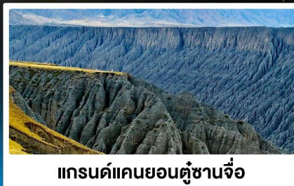
แกรนด์แคนยอนตู้ซานจื่อ