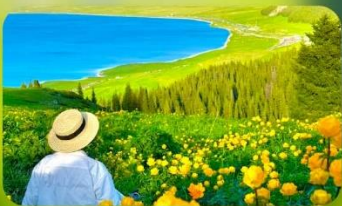
ทะเลสาบไซท์ลี่มู่