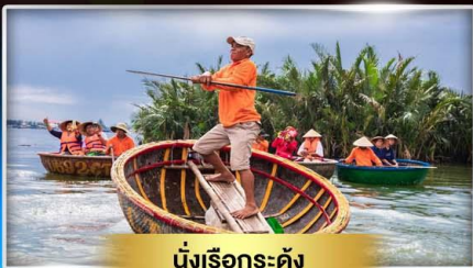
นั่งเรือกระดง

เที่ยวบานาฮิลล์ บินพร้อมกับสายการบินระดับโลก