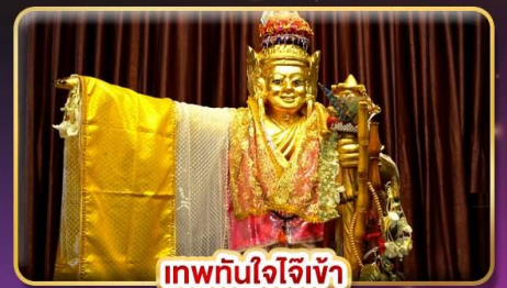
เทพทันใจโจ้เข้า