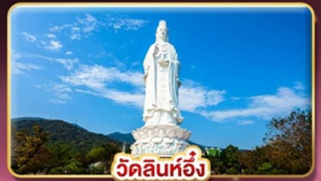
วัดลินห์ฮ้าง