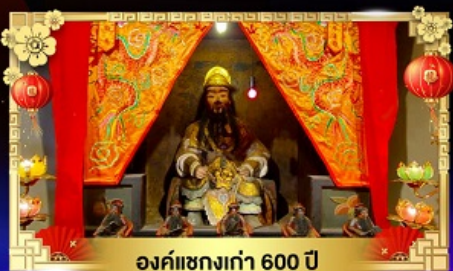
องค์แซงเก่า 600 ปี